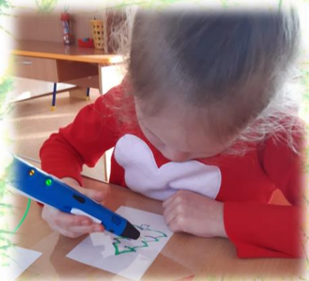
3-Д рисование «Уральский лес»