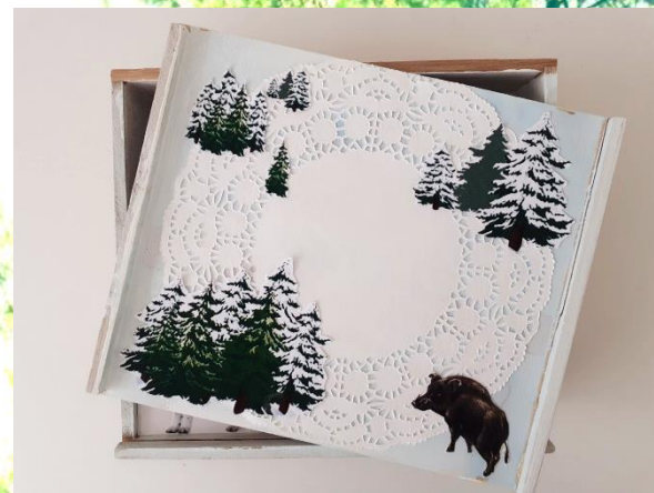
Топорама «Зимний лес»