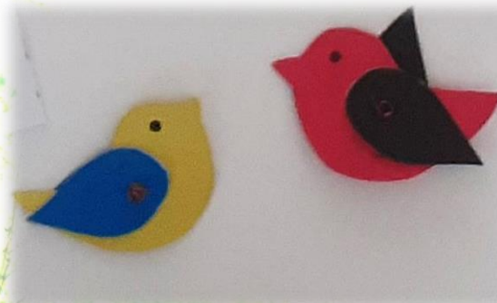
Моделирование «Синичка», «Снегирь»